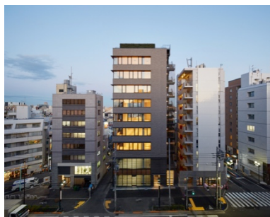
明治通りに面するファサード