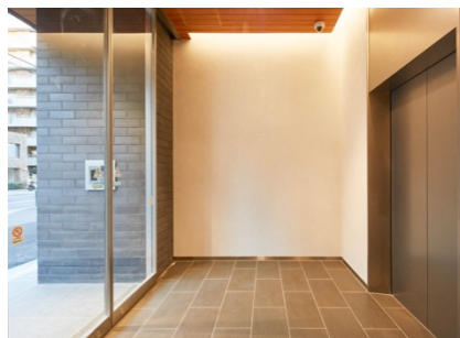
肌理のある素材を使用したエントランスホール